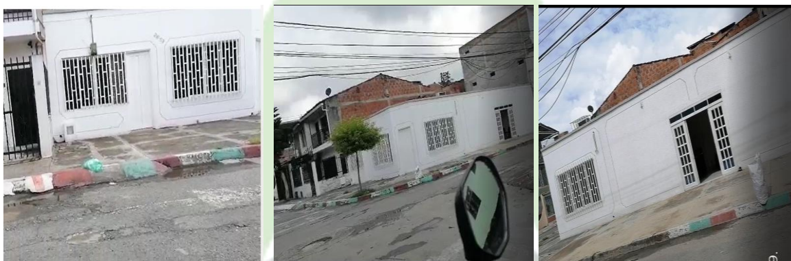
REGISTRO FOTOGRÁFICO DE LA VIVIENDA UBICADA EN LA CARRERA 40 A N° 26-53 BARRIO LA INDEPENDENCIA DE LA CIUDAD DE CALI, RESIDENCIA DONDE APARENTEMENTE LABORA EL ASEGURADO.

Según las diligencias antes realizadas, se obtuvo información que, el asegurado posiblemente, laboraba en una residencia ubicada en la carrera 40ª # 26 – 53, razón por la cual el día 03 de marzo de 2021, nos trasladamos hasta la dirección en mención, con el fin de confirmar si efectivamente el asegurado laboraba en este lugar; estando en el lugar se identificó que corresponde a un sector residencial, donde establecimos comunicación con una persona del sector, a quien nos presentamos como mensajeros, solicitando ayuda de la dirección en mención, quien manifestó que, en el lugar realizan contratos de construcciones y acabados y desconocía de alguna persona que labore en el lugar, la cual utilice auxiliares de marcha “muletas”.